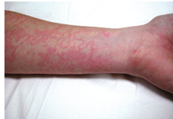
Afbeelding 1. Erythema marginatum.

Bijna alle patiënten met HAE hebben last van recidiverende aanvallen met zeer hevige buikpijn, misselijkheid, braken en diarree. Mucosaal oedeem veroorzaakt een tijdelijke darmobstructie, die tussen de twee en vier dagen aanhoudt.