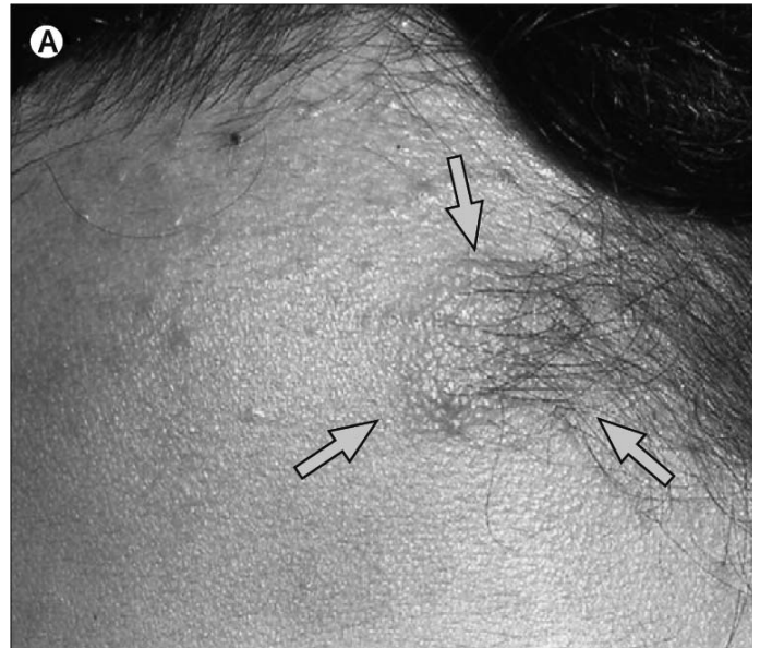
Afbeelding 2: Skin plaques