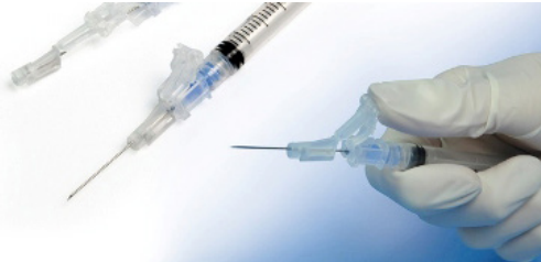
Veilige naaldsystemen 2