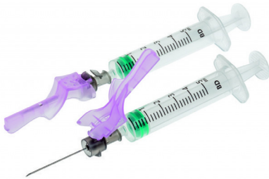
Veilige naaldsystemen 1